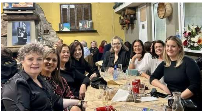
Από την κοπή της πίτας του Συλλόγου Γυναικών Άσκηρς

© Στις 26 Ιανουαρίου 2025 εκδήλωση για την κοπή της πρωτοχρονιάτικης πίτας στην ταβέρνα "Ο ΧΑΡΗΣ" με φαγητό και γλέντι .