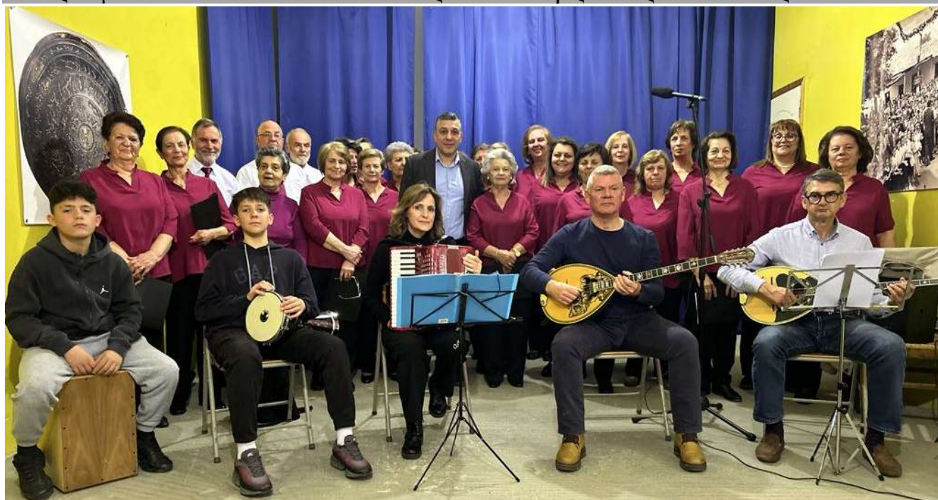
Η μικτή χορωδία Αλιάρτου στη σκηνή του Πνευματικού Κέντρου Άσκρης (φαινόνται η “ Ασπίς Ηρακλέους ” και φωτογραφία από εκδήλωση για τις Μούσες το 1956)

Αριθμός Φύλλου 49 • Ιανουάριος – Φεβρουάριος – Μάρτιος 2025