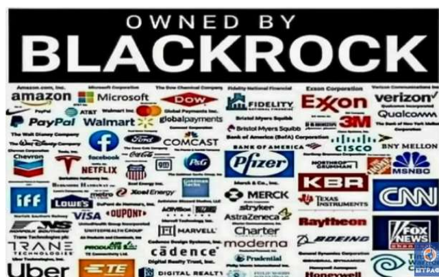
Εταιρείες που ανήκουν στην BLACKROCK